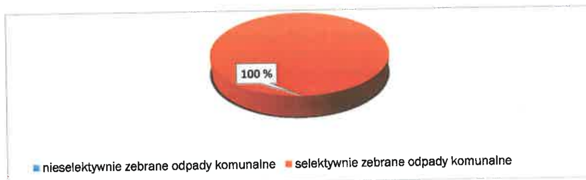
Wyk.2. Procentowy udział nieruchomości mieszanych (w ujęciu ilościowym), które selektywnie i nieselektywnie gromadzą odpady komunalne